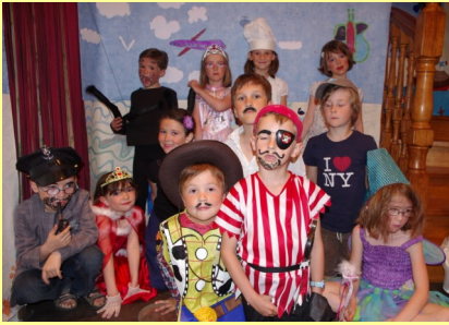
Les enfants de CP/CE1 sur le bateau du Capitaine Haddock dans leur création très réussie de Panique à bord .