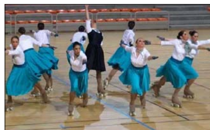
Le Show 6 e au championnat de France en 2014

Équipement : rollers artistiques (matériel spécifique), short cycliste ou jupette et chaussures de sport (obligatoires pour l'échauffement), protège-poignets recommandés. Les patins peuvent être loués au club.