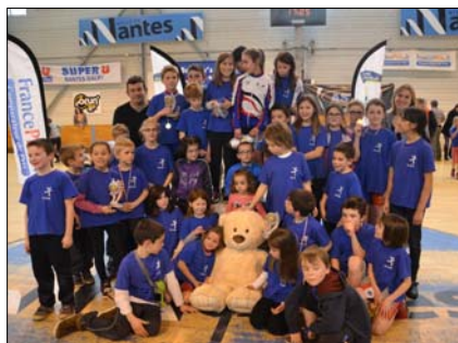
Le Kids Roller 2014 gagné par l'ALSS

Le choix du type de rollers sera fonction du niveau, de la progression et de l'aspiration du patineur. Évitez tout achat précipité ou inadapté.