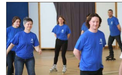
Le Loisir au gala 2014

Équipement conseillé : rollers (tous modèles acceptés), casque (obligatoire), protège-poignets et genouillères.