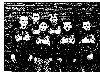
Les poussins de l'ALSS année 2004-2005