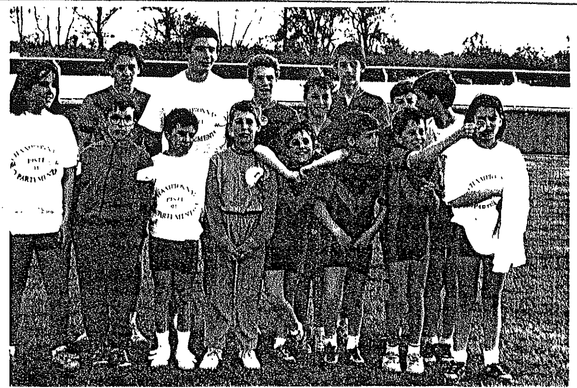
LES PATINEURS SÉLECTIONNÉS POUR LES CHAMPIONNATS RÉGIONAUX À COULAINES (72) LE 28 / 4 / 91.