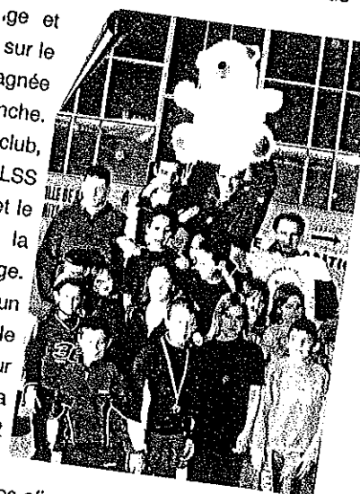
ales afin de devenir peut-être un jour rci à tous les patineurs, aux parents

nants, SSSL - M... s 7h30 Hotel d... Prévoir piqués gagnés t de rechange manche. avec les roues le club, 5, Centre R. l'ALSS Préparation sur le et le ion, Relaxation sur la user aux visiteurs l'enge. nistratives (qu'un n de sortie é... le Pour cela ant ed